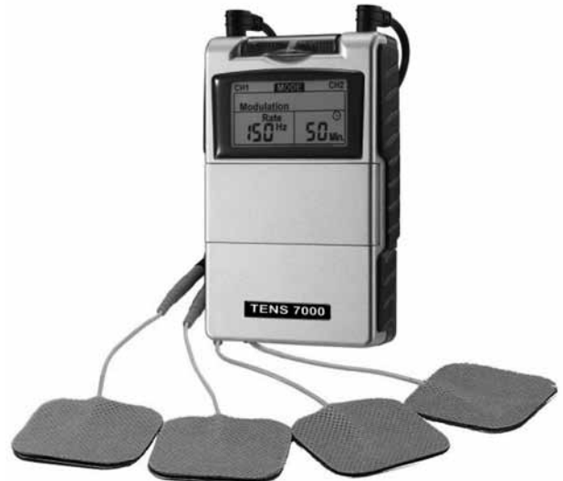
Şekil 4. Transkütanöz elektriksel sinir uyarım cihazı.

Hastanın yaşadığı çevrenin, fiziksel ve sosyal etmenlerin incelenerek uygun şekilde düzenlenmesine yardımcı olunmalıdır. Bunlar arasında; hastanın kullandığı klozet ve sandalye yüksekliklerinin artırılması, sandalye boyunun çalıştığı masaya uygun biçimde ayarlanması, hastanın rahat yürüebilmesi için yerlerin düzgün ve kaymayan malzemelerle kaplanması, uzun saplı ayakkabı çekeceği ve süpürge