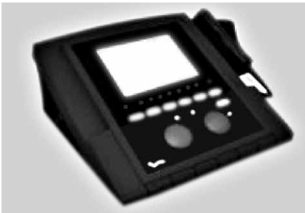
Şekil 3. Ultrason cihazı.

Osteoartritte fonksiyonel kısıtlılıkla ilişkili olduğu bilinen en önemli faktörler kas zayıflığı, kısıtlı eklem hareket açıklığı ve azalmış aerobik kondisyonudur. [36-38] Egzersiz tedavisi kas iskelet sisteminde, kas kütlelerinde ve kuvvetinde artma, eklem hareket açıklığında düzelme, propriyosepsiyonda artma, reaksiyon zamanında düzelme, dengeyi düzelterek düşmede azal-