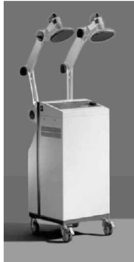
Şekil 2. Kısa dalga diyatermi cihazı.

Elektrik akımlarının, ağrı kesici ve trofik etkilerinden faydalanmak üzere tedavi amaçlı kullanımları vardır. [34] Bu amaçla orta ve alçak frekanslı akımlar kullanılabilir. En yaygın olarak kullanılan